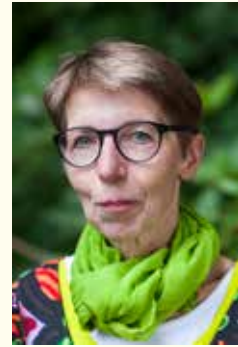
Martlies Plate 1957, 2 Kinder Fremdsprachensekr.

Die Personen mit grünem Namen kandidieren sowohl für den (örtlichen) Gemeinderat als auch für den Samtgemeinderat.